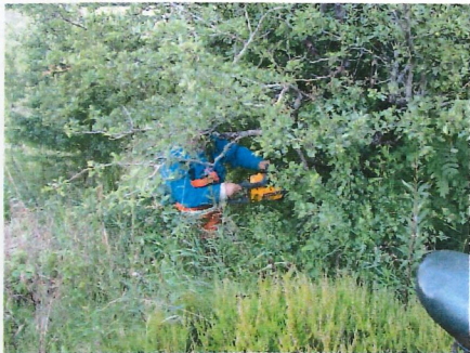
Træfældning på banen