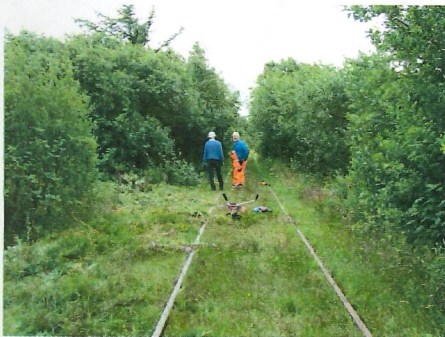
Træfældning på banen